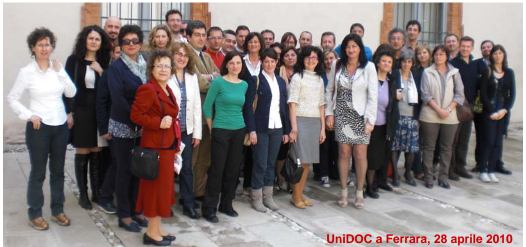
UniDOC a Ferrara, 28 aprile 2010

Il commento e il vivace dibattito che ne è seguito hanno evidenziato come i principali punti critici