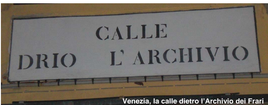
Venezia, la calle dietro l'Archivio dei Frari

Un'eventuale pubblicazione in versione digitale delle tesi di laurea da parte di qualsiasi soggetto deve prevedere un'autorizzazione da parte dell'autore dell'elaborato stesso in quanto, se la digitalizzazione può essere lecita come azione ai fini di una conservazione o come prassi per documenti di tipo amministrativo, una pubblicazione richiede comunque un'autorizzazione.