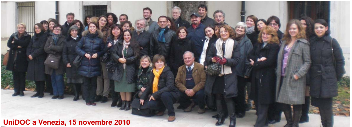
UniDOC a Venezia, 15 novembre 2010

Per queste caratteristiche la materia va interpretata sotto diversi punti di vista e, in prima battuta vanno distinte le tesi di dottorato da tutte le altre tipologie di tesi, in quanto per loro natura sono il compimento o almeno una tappa quasi conclusiva di un lungo itinerario di ricerca. Per questo particolare aspetto le tesi di dottorato possono essere paragonate ai pre-print , anche se alcuni giuristi ritengono che il deposito legale disposto per legge per queste tesi le equipari a delle pubblicazioni vere e proprie, a maggior ragione se si pensa che le te-