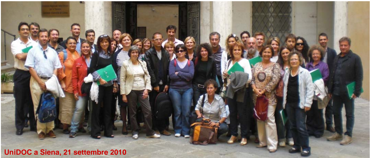
UniDOC a Siena, 21 settembre 2010

dranno razionalizzati studiando la tempistica per la conclusione di ogni singolo adempimento procedimentale, in modo da eliminare quei passaggi che appesantiscono, spesso inutilmente, l'attività dell'amministrazione e ritardano la conclusione del procedimento.