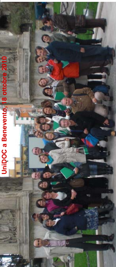
UniDOC a Benevento, 18 ottobre 2010