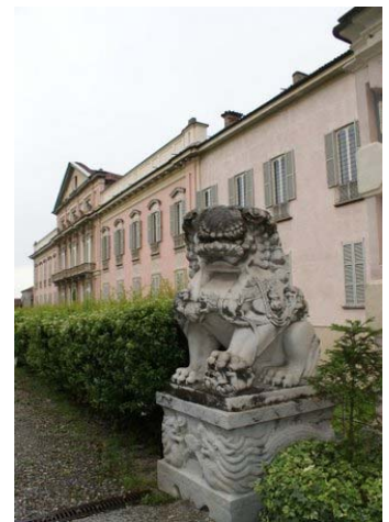
A sinistra e sopra: vedute del Castello di Belgioioso Qui sotto: una delle sale della riunione di UniDOC; In calce: una lapide con l'Archicancellarius

Splendida la location , splendida Paola Carucci.