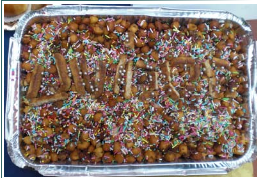
Gli struffoli di Capasso con la scritta "UniDOC"

Ecco gli enti che hanno partecipato agli eventi di formazione